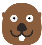
Bäver = Ångermanland