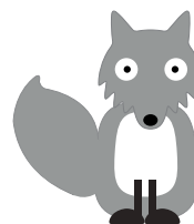
Fjällräv = Lappland